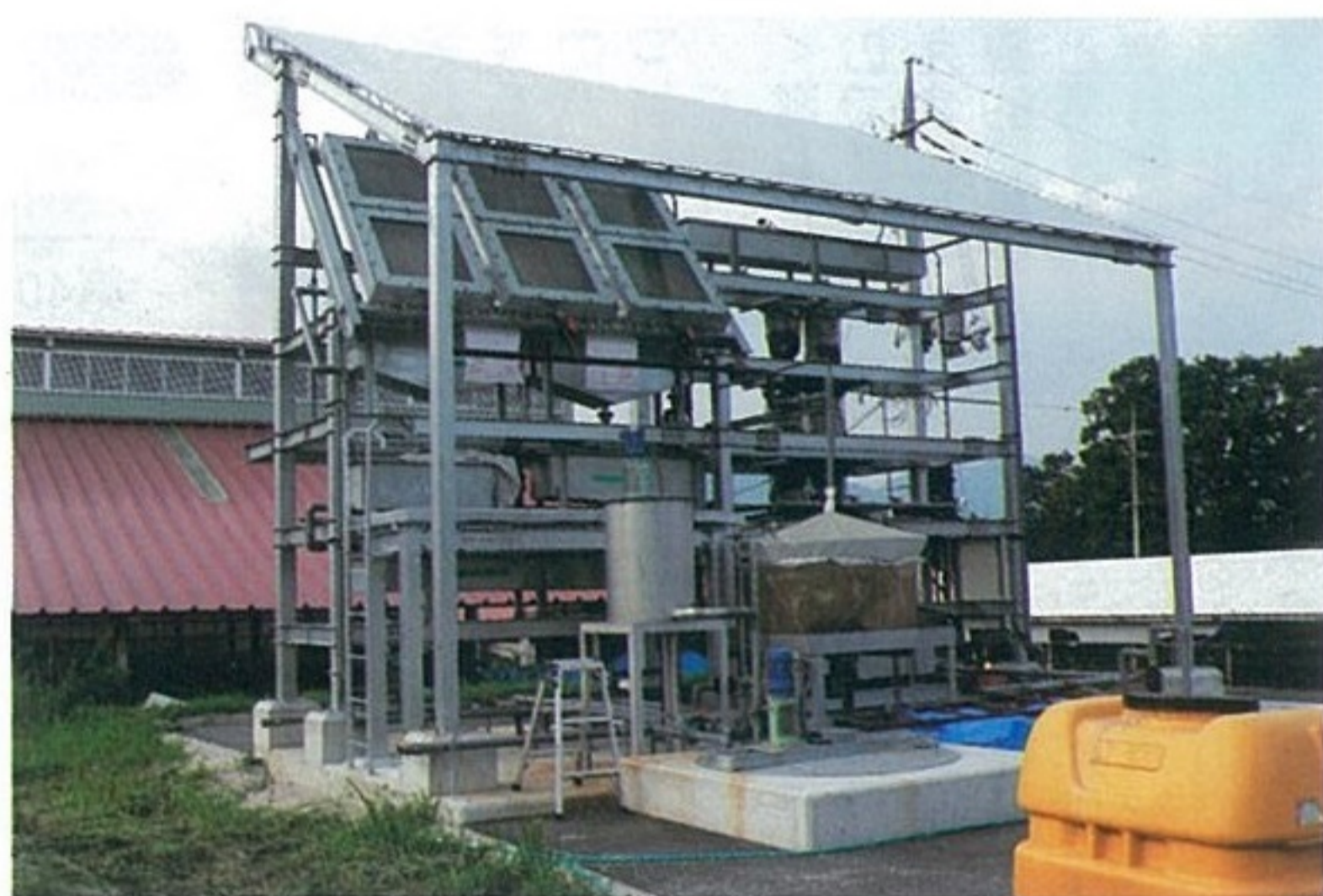
貝殻を利用した畜舎排水システム

廃棄物を浄化するという一石二鳥のシステムです。西日本では、酪大の他、愛媛県畜産試験場で実証展示がされておりありますが、酪大の機械は、岡山県特産のカキの殻を利用して前校長のアイデアにより尿を加熱し、消臭等の効果が図られる機能も新たに加えられると思っております。皆様にも利用される良い結果が出ればと