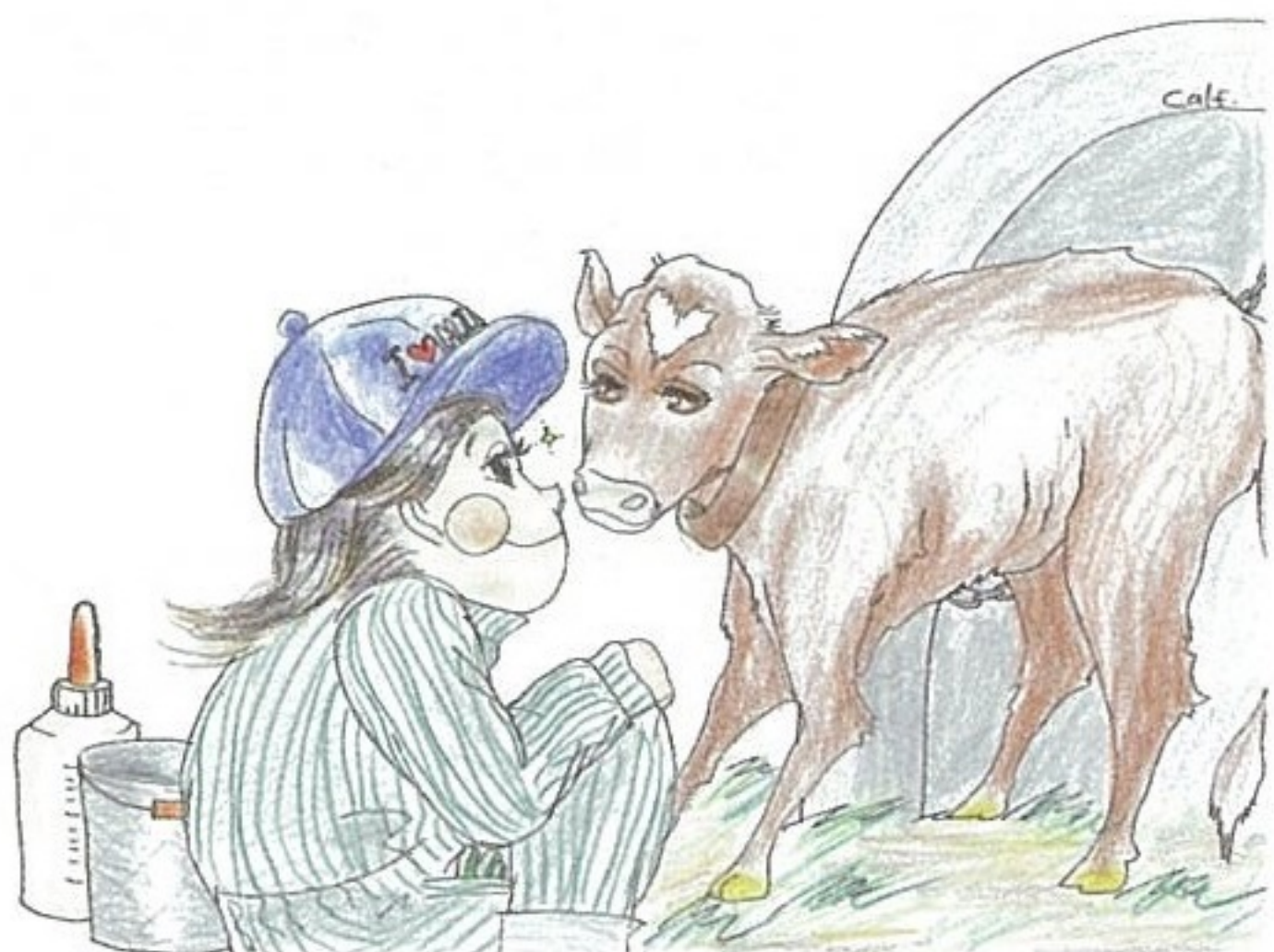
イラスト：宇時 理恵

「自分、テンパつとるで」と先輩ヘルパーさんにツッコまれます。そんな中でも、農家の方の「ヘルパーさん助かるわあ」という一言が、明日も頑張ろうと元気をくれます。