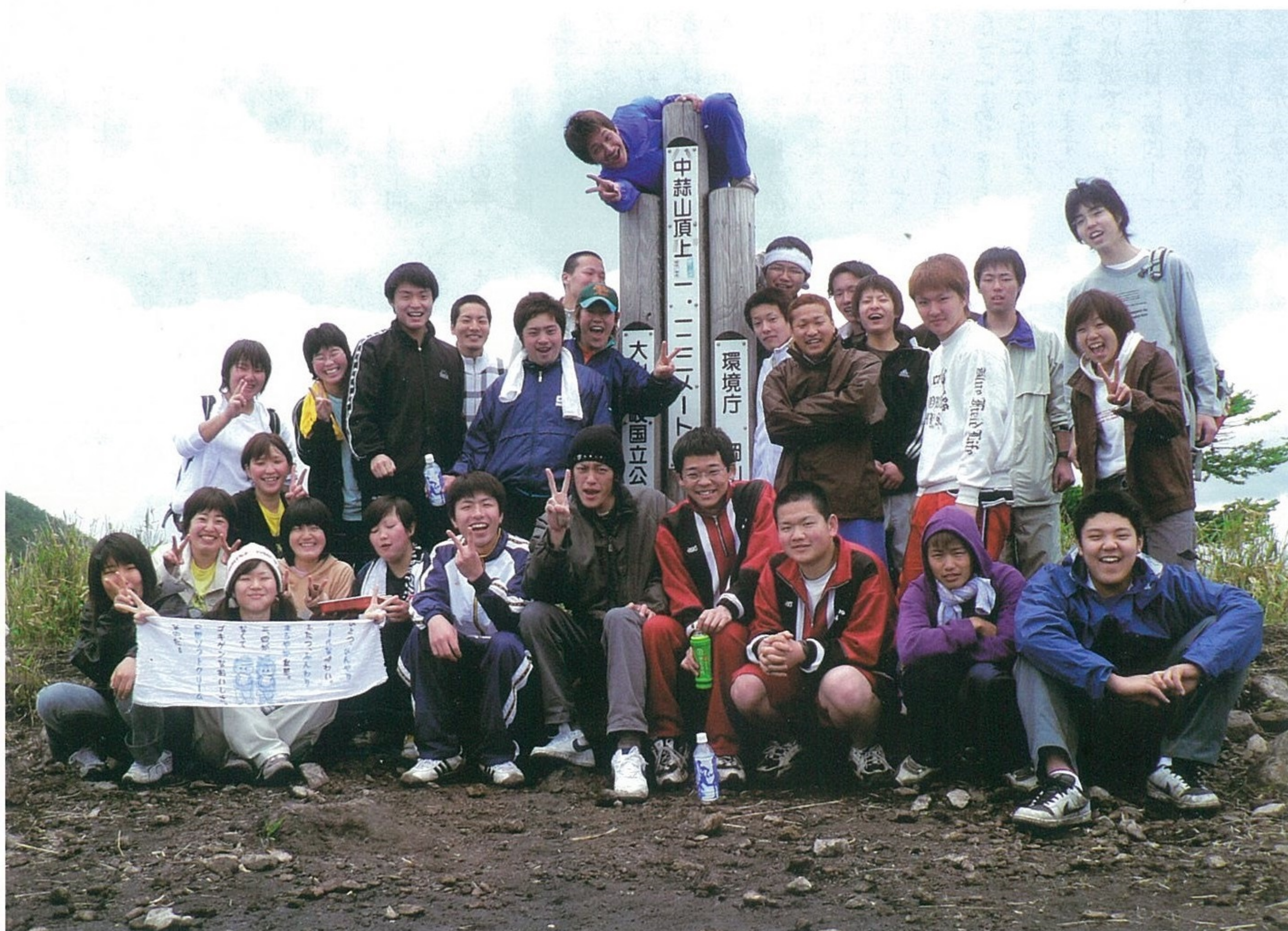
第41期生 蒜山登山 中蒜山山頂にて