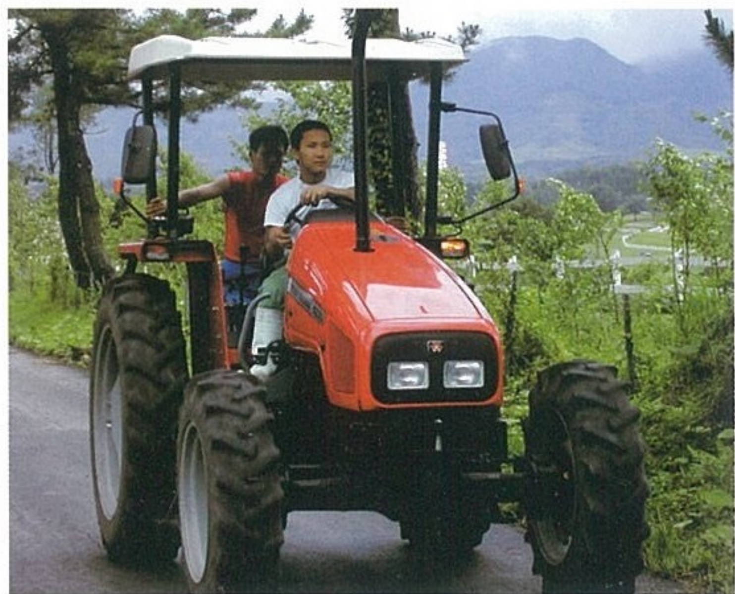
ポプラ並木を疾走!!

もうひとつ、毎日早朝から夜遅くまで友達と話をしたり、将来の自分の夢の話をしたことも沢山あり、その一つ一つが僕の