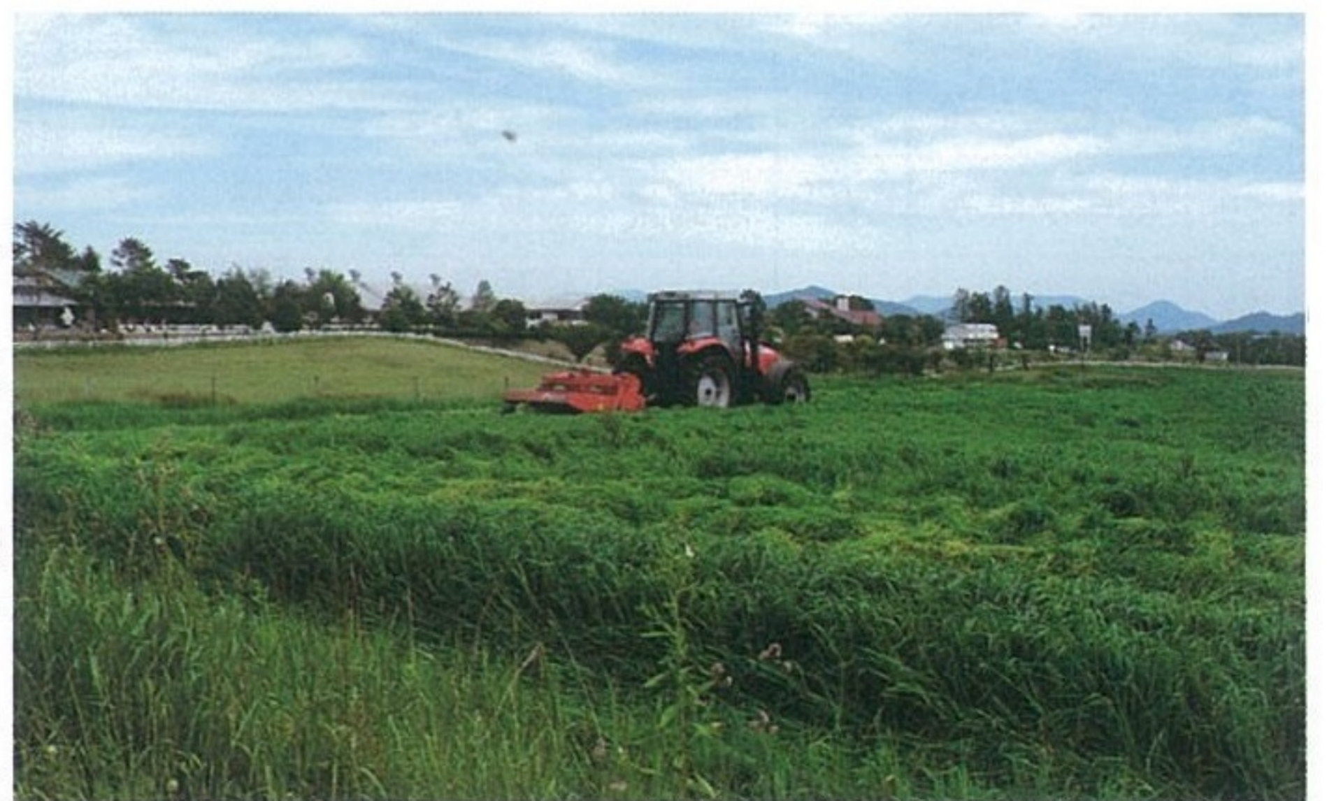
チモシー刈り取り風景

の播種を行いました。チモシーは寒冷地での生育に適しており、蒜山地域でも作付け農家が増え始めています。そのため、岡山県の品種選定試験の実証試験として二種類の品種を播種しています。播種は台風の影響で十月下旬となりましたが、その後の冷え込みが少なく無事に発芽し、現在は順調に生育しています。今後は収量や次年度以降の生育をみる予定です。